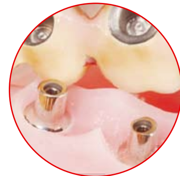
Implantate mit Brücke