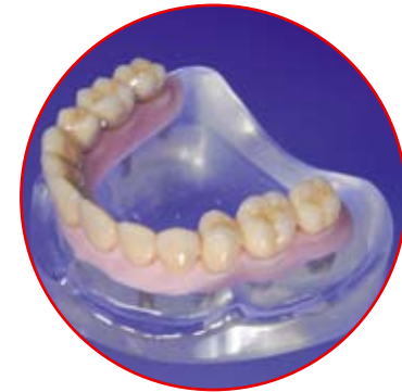
Implantatbrücke auf Modell