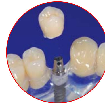
Einzelkrone auf Implantat