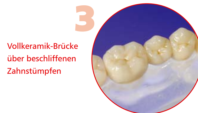
Vollkeramik-Brücke über beschliffenen Zahnstümpfen