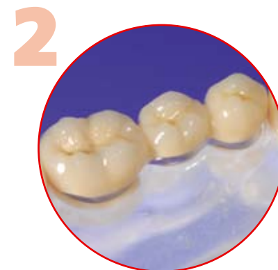
Vollverblendete Metallkeramik-Brücke mit Goldrand